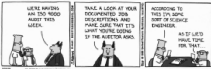
DLBERT™ by Scott Adams

Mais, le festival du TWH ratisse large. Harnachement controversé des petits barrages, dérivation de la plus grande des dernières grandes rivières du Grand Nord, fabrication d'un marché de l'électricité à la réglementation harmonisée US-Québec-Maritimes, projet Neptune (ligne d'exportation sous-marine aux USA d'énergie hydro-électrique partenariale Labrador-Québec), formidables ambitions énergétiques qui perfusent au travers de la Paix des Braves, projet privé de centrale à gaz à Varennes, toutes les options se bousculent sur la scène; la guerre au déficit énergétique est en marche et ne